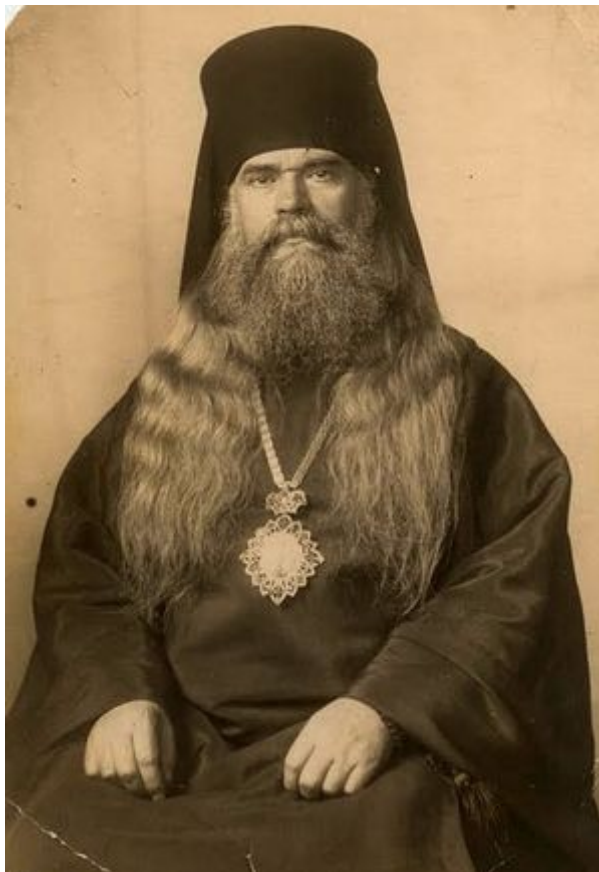
Архиепископ Серафим (Соболев)

Много времени прошло с того дня, когда со мной совершилось чудо исцеления у гроба Дедушки владыки Серафима [2] . А через года два или три я узнала, что свидетельства о подобных случаях собирают, чтобы канонизировать Дедушку. Неблагодарность – вот единственное слово, которое я могу сказать о себе, поскольку только сейчас нашла время и совесть, чтобы написать о том, что случилось со мной тогда. Так что и я уподобилась тем девяти евангельским исцеленным, которые не вернулись, чтобы поблагодарить Христа [3] . Поэтому испрашиваю прощения от всей души.