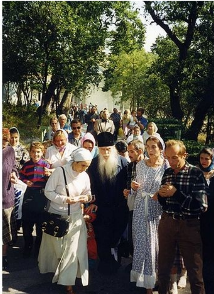
Архимандрит Кирилл (Павлов) в Крыму

Два раза отец Кирилл исповедовался у меня. Все ушли, он снимает епитрахиль, надевает на меня: «Поисповедуй меня». У меня, конечно, душа перевернулась! И вот батюшка каялся очень смиренно, кротко – в таких мелочах, о которых я сам на исповеди никогда не говорил. Потом, когда я анализировал эту исповедь, подумал: наверное, батюшка за меня каялся, показывал мне, что нужно исповедоваться во всем, в том числе в этих грехах.