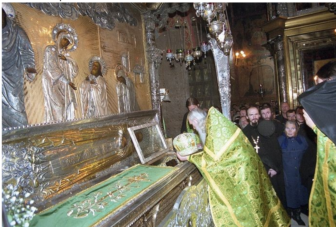
Архимандрит Кирилл (Павлов) у мощей Преподобного Сергия

Я старался всегда ходить к батюшке на правило, которое совершалось перед обедом в 12 часов. Отец Кирилл приходил из посылочной, где он принимал людей мирских, и мы читали три канона с акафистом Иисусу Сладчайшему. Затем батюшка сам уже читал Псалтирь – одну кафизму или более, Апостол и Евангелие. Иногда, бывало, кто-нибудь на Правиле засыпал от переутомления, и тогда батюшка говорил: не трогайте – тело спит, душа молится. Иногда кто-то опаздывал на Правило, и ему не доставалось прочесть ничего. Тогда батюшка в конце нашей встречи возглашал: «Отцу такому-то (иеромонаху, иподиакону), пришедшему в двенадцатый час на Правило, так, что ему не досталось прочесть акафист, – многая лета». И все пели «Многая лета». И это было удивительно. А брату, которого вроде и не ругают, а хвалят, многолетие поют, в следующий раз было стыдно опаздывать к батюшке на Правило.