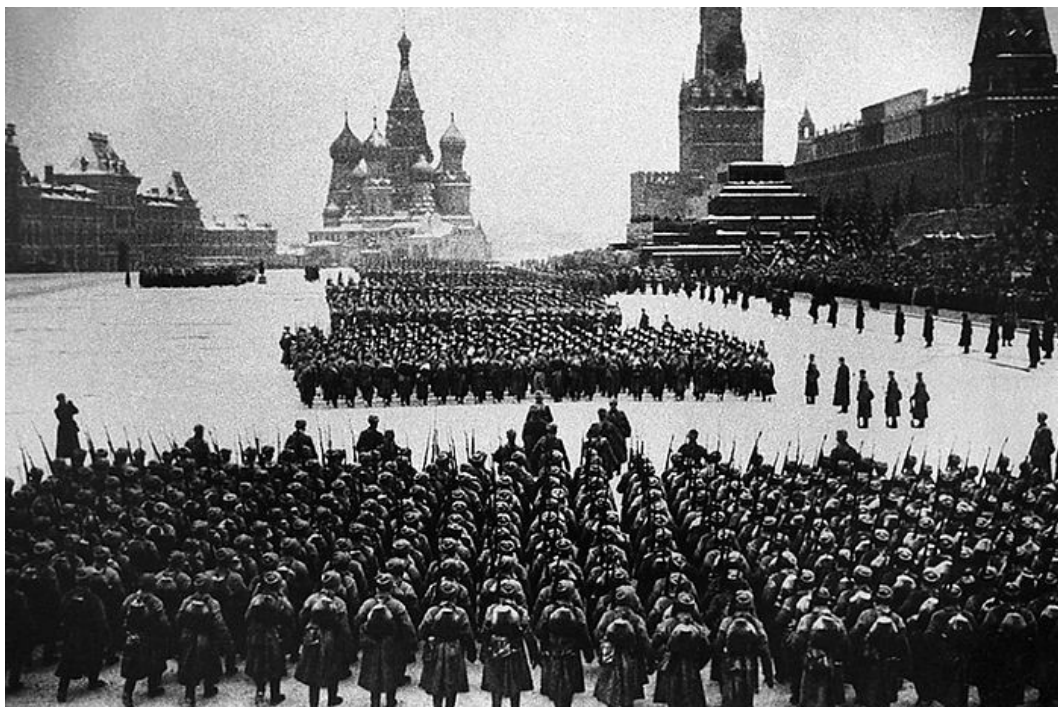
Парад 7 ноября 1941 г. на Красной площади